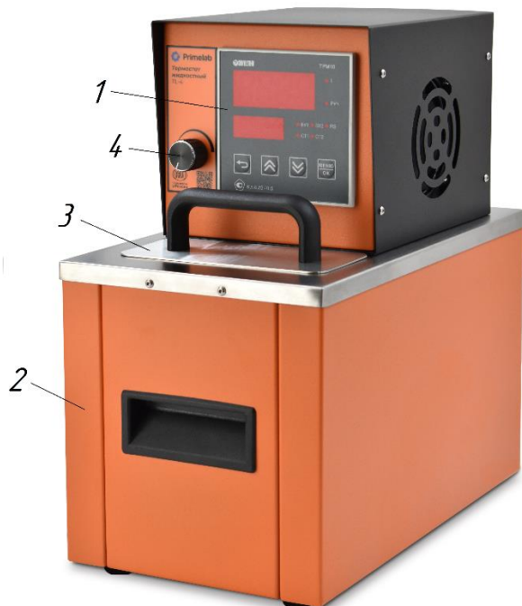
Рис. 1 Конструкция прибора

6.1.1 Внешний вид прибора показан на рисунке 1;