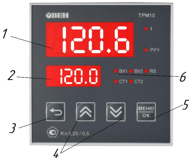
Рис. 2 Блок регулировки температуры

9.1.2 После включения прибора дисплее отобразится информация о прошивке и предустановленная температура (п.2, Рис. 2);